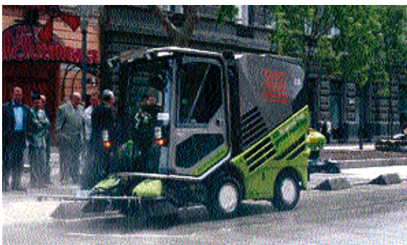
A nagy hatékonyságú járdatarító-gép már bemutatkozott a fővárosban

sam a környezetvédelmi és közrendvédelmi bizottság elnöke a pályázati anyagban kérte, hogy szerepeljen üzemeltetési/üzembentartási támogatás megszerzése is pályázatunkban, mely garantálja a folyamatos működtetést.