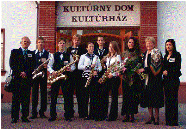
A Molnár Antal Zeneiskola delegációja

igazgatónőtől. - A három napos rendezvényen különböző programokon vehettünk részt, tapasztalatokat szereztünk és barátságok köttetek énekes szólistánk, hárfa cselló és orgonakísérettel felléphetett a helyi nőikkal közösen a templomi hangversenyen; szaxofonegyüttesünk a gála-koncerten szerepelt nagy sikerrel.