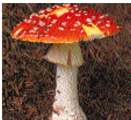
Szép, de veszélyes

Csak gombavizsgáló által vizsgált erdei gombát vásároljunk. Ha magunk szedjük, akkor is ellenőriztessük a kosár tartalmát!