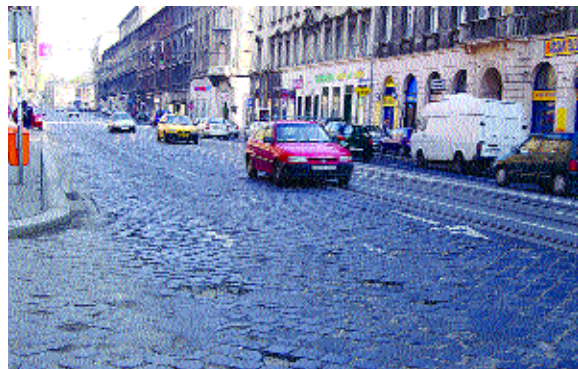
A Thököly út

testületünk egyetért a 4-es metróvonal építésénél a mélyvezetésű, pajzsos technológia alkalmazásával; támogatja a Thököly út előrehozott, a 4-es metrótól független, legkorábbi időpontban törté-